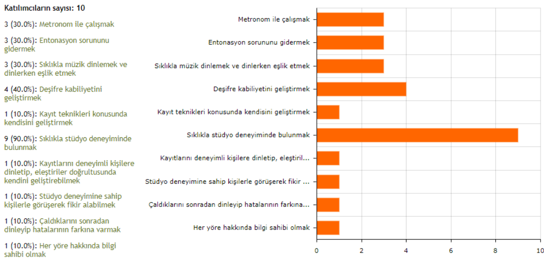
Şekil 3. Profesyonel Stüdyolarda Görev Alan Kabak Kemane Sanatçılarının Stüdyo Müzisyeni Olma Yolunda İlerlemek İsteyen Müzisyenlere Önerileri

“Profesyonel stüdyolarda görev alan kabak kemane sanatçılarının stüdyo müzisyeni olma yolunda ilerlemek isteyen müzisyenlere önerileri nelerdir?” alt problemine ait bulgular aşağıda verilmiştir.