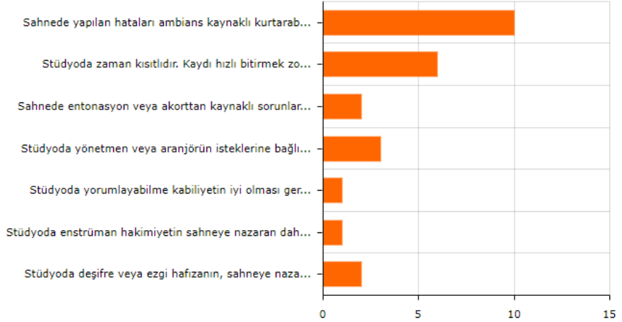
Şekil 4. Profesyonel Stüdyolarda Görev Alan Kabak Kemane Sanatçılarının Sahne ve Stüdyo Performansı Hakkındaki Görüşleri

2 (20.0%): Stüdyoda deşifre veya ezgi hafızanın, sahneye nazaran daha iyi olması gerekmektedir